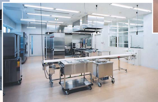
給食経営管理実習室 (神奈川県立保健福祉大学)