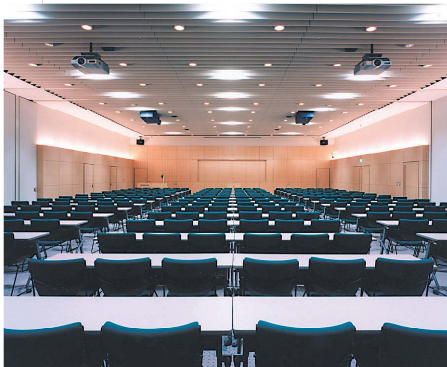
部屋の分割に対応し多彩な利用が可能なマルチメディアルーム (慶應義塾大学理工学部 創想館)

自由に情報を発信・検索・受信するインターネット世代の要望に応えられる次代を見据えたメディア機能とインフラの整備で、総合的な教育環境の構築をお手伝いします。