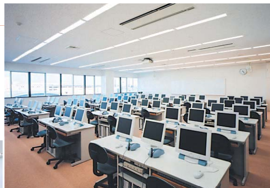
LL教室(神奈川県立保健福祉大学)