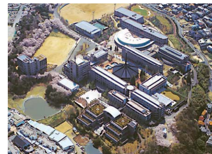
学校の理念を形にあらわしたキャンパスマスタープラン (四天王寺国際仏教大学)