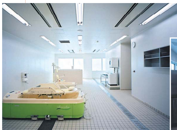
入浴介護実習室 (神奈川県立保健福祉大学)

高度化・専門化した総合的な教育環境の整備により、時代のニーズに応え世界で活躍できる人材を育む学校をつくります。