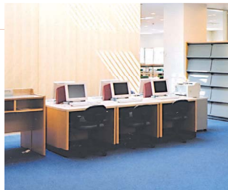
図書検索システム(神奈川県立保健福祉大学)