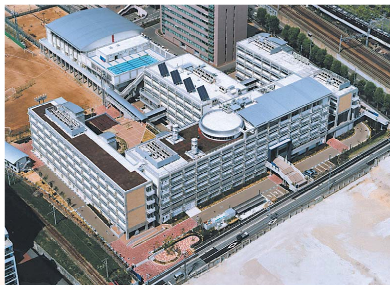
「ものづくり」を学ぶ場にふさわしく、建物自体が教材となる学校(神戸市立科学技術高等学校)