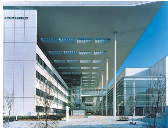
ひとつの屋根でキャンパスを包み 学校のアイデンティティを表現 (神奈川県立保健福祉大学)

個性を象徴して学校のアイデンティティとイメージを広く発信するとともに、ランドマークとして地域や社会に親しまれ、シンボルとなる建物をつくります。