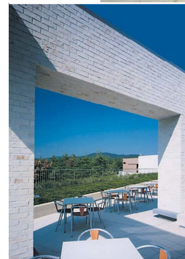
中学・高校・大学の食堂をひとつにまとめ、多様なインタフェイスを触発 (追手門学院)