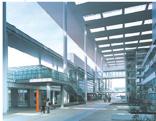
キャンパス内外の人々が集う「交流プラザ」 (神奈川県立保健福祉大学)

日常の交流の範囲にとどまらず、分野の異なる人々との出会いや地域との交流を通じて、様々な発見や触発を生む仕掛けとしての空間をつくります。