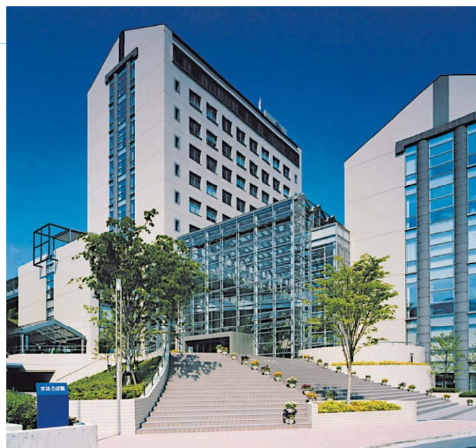
インナーテラスやデッキのあるアトリウムがゆとりある学園生活を演出 (安田女子大学)