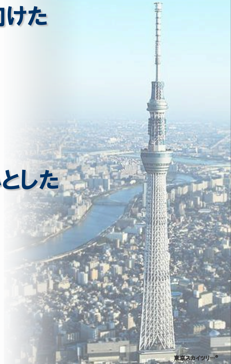
東京スカイツリー®