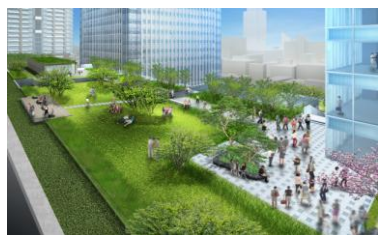
「北館テラスガーデン」