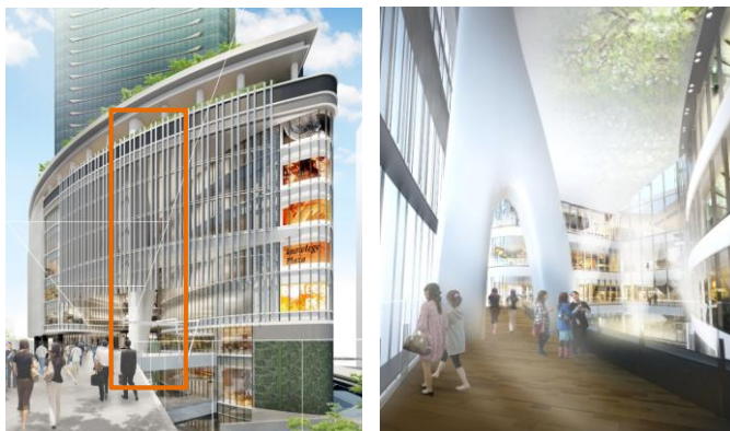
「ウィッシュボーン」（全体、南館5F）