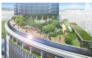
「南館テラスガーデン」